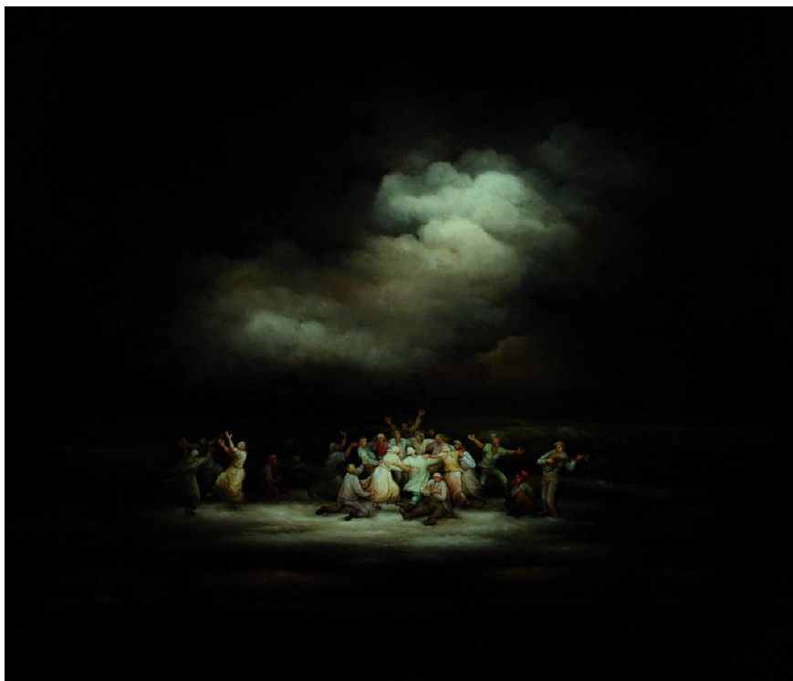
Slika 2. Nada Švegović Budaj: Ples , 1989.

1. Nada Švegović Budaj: Ples , 1989., ulje, staklo, 600x700 mm, inv. br. 1879.