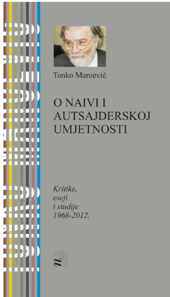
Slika 3. Tonko Maroević: O naivi i autsajderskoj umjetnosti , 2013.