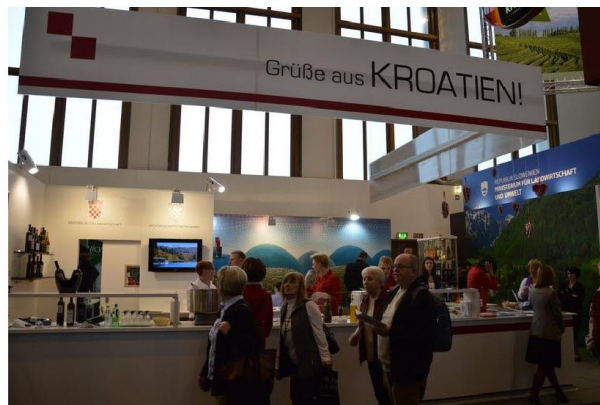
• Slika 5. Rabuzin - Internationale Grüne Woche, Berlin 18-27. siječnja 2013.