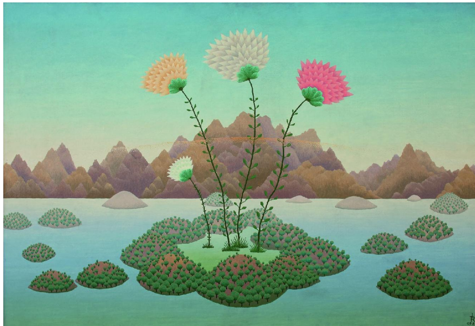
Slika 1. Ivan Rabuzin: Otoci , 1963.

1. Ivan Rabuzin: Otoci , 1963., ulje, platno, 890x1300 mm, inv. br. 1880.